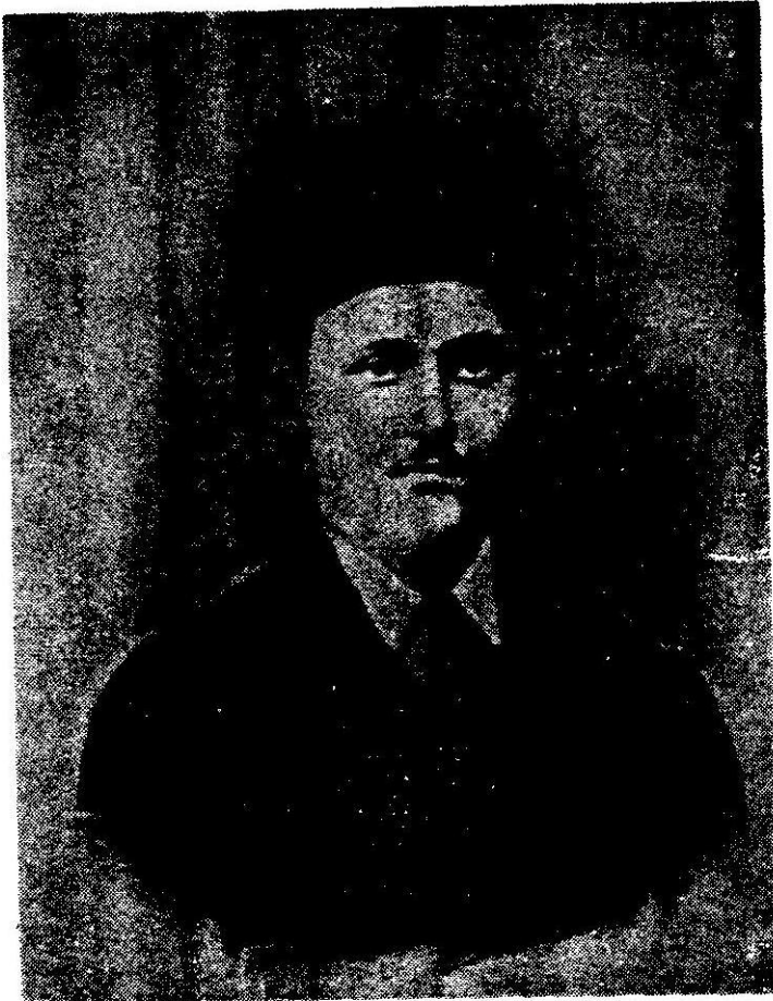
تصویری از شوقی افندی